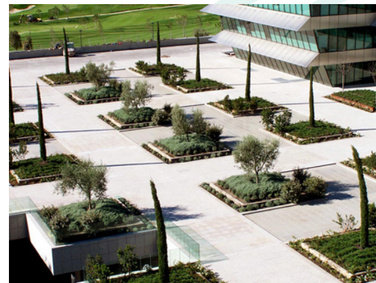
Banco de Santander – Boadilla del Monte

Colegio Oficial de Peritos e Ingenieros Técnicos Industriales de Málaga