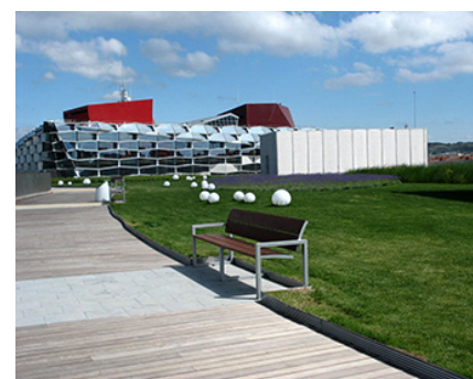
Expo Zaragoza 2008