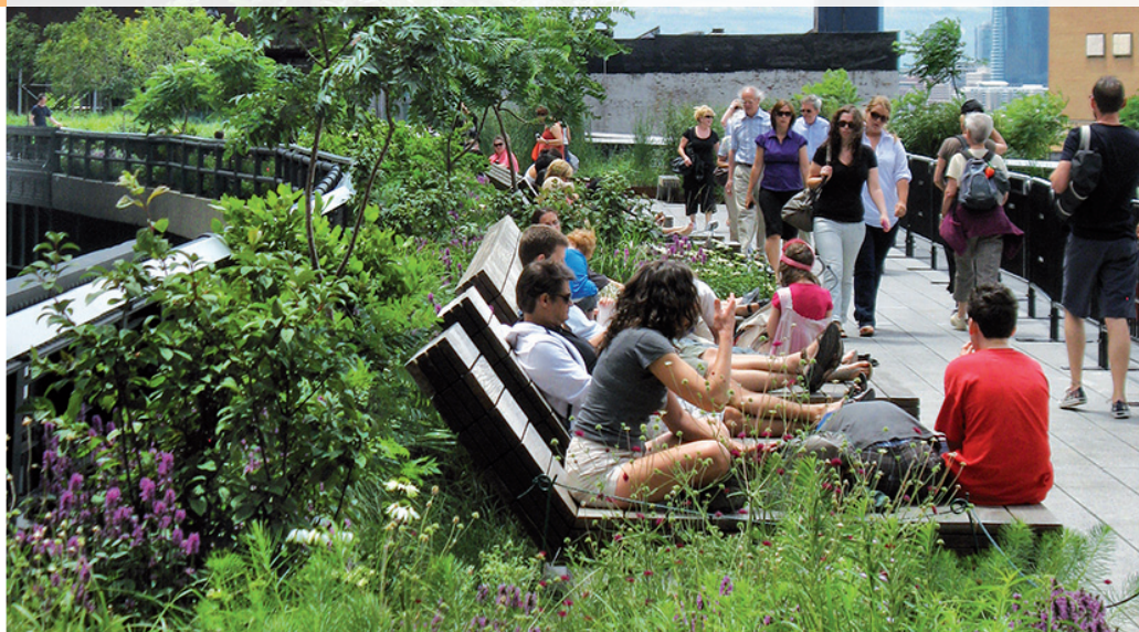
High Line Park – Nueva York Mención en el "City to City Barcelona FAD Award"