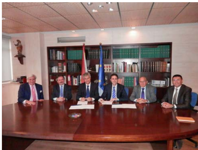
Firma del convenio de colaboración, en la sede del COGITI.

De esta manera, las entidades asociadas a FEDAOC podrán “captar” el mejor talento, mediante la publicación de ofertas de empleo dirigidas a Graduados en Ingeniería de la rama industrial e Ingenieros Técnicos