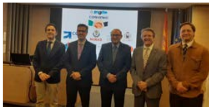
Representantes de las Organizaciones suscriben con COGITI, sendos convenios de colaboración en materia de formación.

La plataforma de formación e-learning se puso en marcha en 2012 y desde entonces no ha parado de crecer. La necesidad de un «reciclaje» profesional continuo, y la gran diversidad de tareas en las que pueden verse implicados los Graduados en Ingeniería de la rama Industrial e Ingenieros Técnicos Industriales, hacen de la formación continua una de las principales demandas de estos profesionales, así como del resto de colectivos, que también pueden acceder a la plataforma si lo desean.