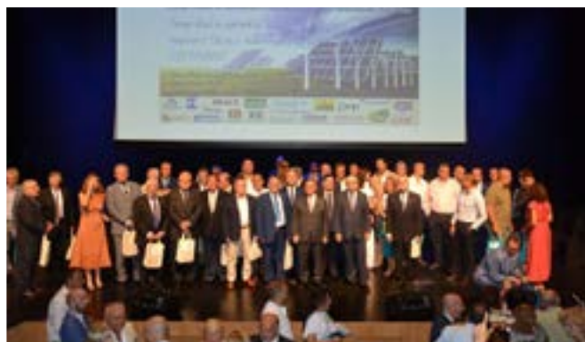
Homenajeados en el XV Día de la Profesión de Málaga

La jornada de convivencia se desarrolló en un entorno insuperable, donde tuvieron lugar una serie de merecidos homenajes que congregaron un multitudinario auditorio "Edgar Neville" de la diputación malagueña.